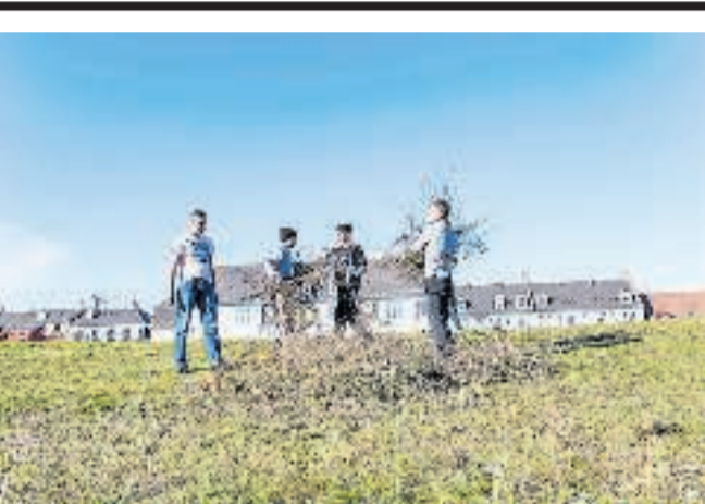
▲ De socialt udsatte unge, der deltager i Fritidsakademiet, får praktiske, lønnede opgaver, så de bedre kan føle sig som en del af samfundet og blive klar til arbejdsmarkedet.

Sammenfattende rummer flirten derfor de største styrker og muligheder på kort sigt for de to partier og de største svagheder og trusler på længere sigt. De sidste særligt for Dansk Folkeparti.