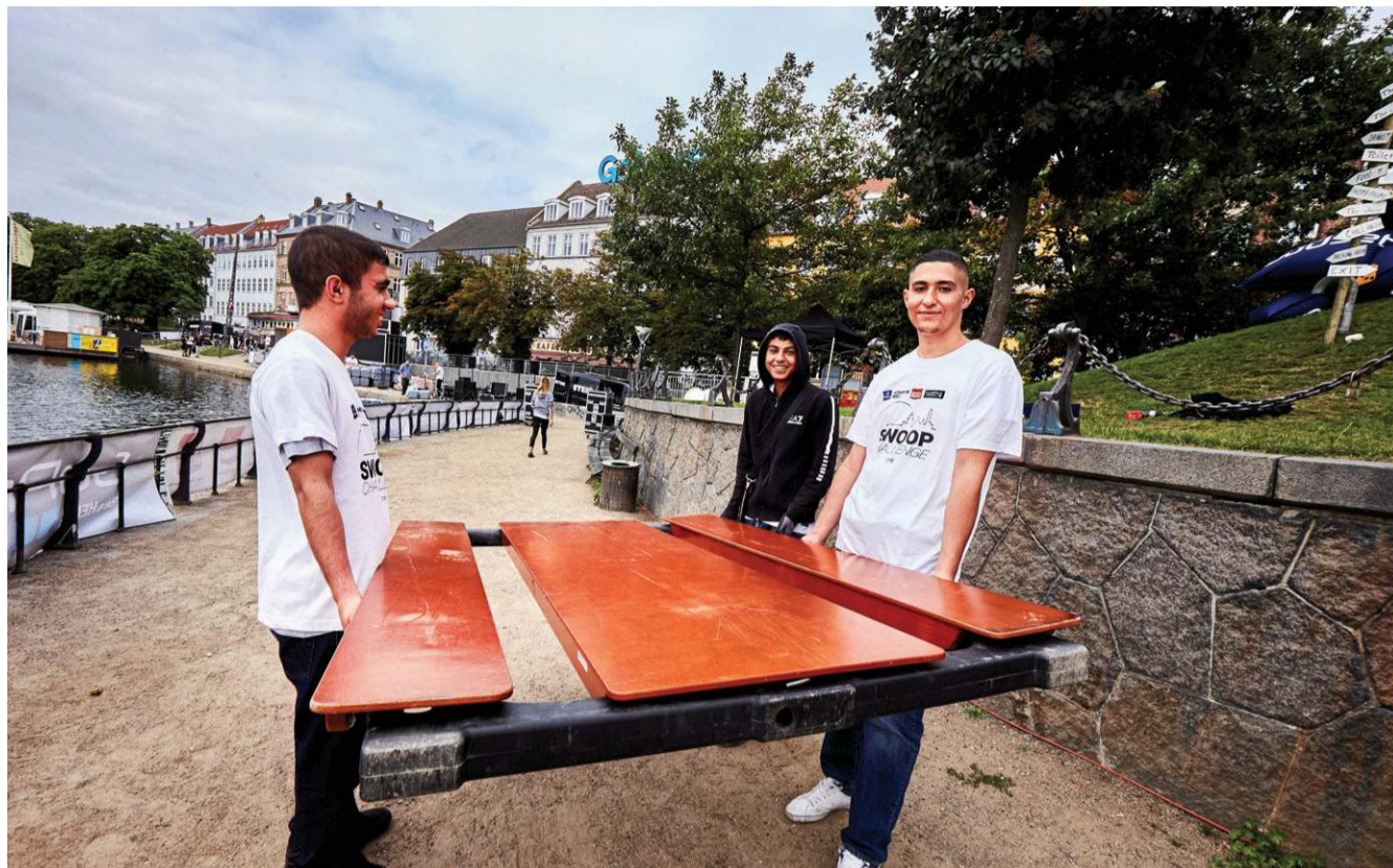
Der var nok at se til for de unge fra Fritidsakademiet på Nørrebro, som var blevet hyret til at hjælpe med forberedelserne til Copenhagen Swoop Challenge sidste weekend.

Drengene har været en del af Fritidsakademiet i cirka halvandet år. En organisati-