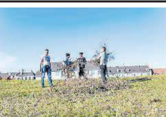
▲ De socialt udsatte unge, der deltager i Fritidsakademiet, får praktiske, lønnede opgaver, så de bedre kan føle sig som en del af samfundet og blive klar til arbejdsmarkedet.

Sammenfattende rummer flirten derfor de største styrker og muligheder på kort sigt for de to partier og de største svagheder og trusler på længere sigt. De sidste særligt for Dansk Folkeparti.