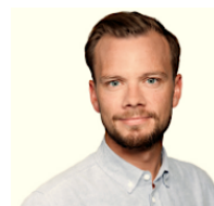
PETER HUMMELGAARD THOMSEN Beskæftigelsesministeren åbner konferencen